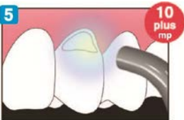
Világítsa meg 10 másodpercen keresztül!