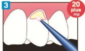
Dörzsölje le a felesleget!